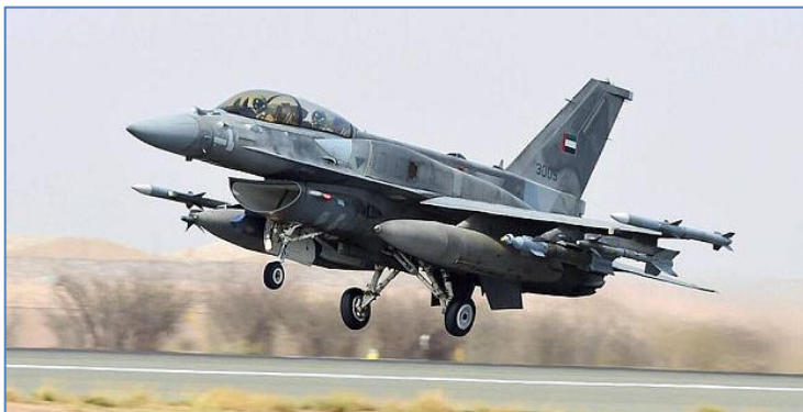
Foto: Un Avión F16F Block 60 de la Fuerza Aérea de UAE despegando desde una base militar de la coalición como parte de la Operación "Decesive Storm".

Los primeros días de la operación fueron los más intensos, con ataques aéreos dirigidos en contra de las instalaciones de defensa aérea y bases en manos de los rebeldes, logrando destruir algunas posiciones y aviones en tierra. Los principales blancos atacados fueron las instalaciones militares en el aeropuerto internacional de Aden , la base aérea de Al Tarik , en las proximidades de Taiz y la base de Abyan . También se alcanzaron instalaciones de radar en Marib y se atacaron instalaciones y posiciones rebeldes en las zonas de Al Hudaydah , Sadah y de la capital, Saná . Asimismo, se atacaron convoyes de tanques, vehículos blindados y camiones que formaban parte de una ofensiva rebelde en contra de Aden , logrando detener la ofensiva rebelde hacia el sur.