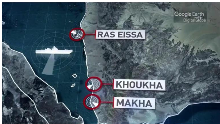
Foto: Posiciones de radares en Yemen atacadas con misiles Tomahawks por parte de la marina norteamericana.

De acuerdo a las fuentes del Pentágono, durante la semana pasada, el destructor USS Mason fue objeto de ataques con misiles tierra-superficie, disparados desde la costa de Yemen, en el territorio controlado por los rebeldes hutíes (huthis o houthis) , alineados con Irán. Según lo informado, los misiles fueron interceptados (o interferidos), cayendo sobre las aguas internacionales frente al estrecho de Bob el Mandeb , la entrada al Mar Rojo por el sur, una zona por la que pasan alrededor de 20.000 barcos cada año. Como represalia, el buque norteamericano atacó el jueves tres posiciones de radares costeros en Yemen, lo que se identifica como la primera acción militar directa de los EE.UU. de Norteamérica, en el conflicto de Yemen.