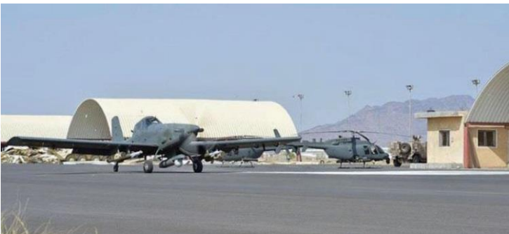
Foto: La fotografía difundida en octubre del 2015 muestra un "Air tractors" AT-802 en la base de Al-Anad , utilizados en los ataques a las posiciones rebeldes hutíes. También se observan al fondo dos helicópteros armados Bell 407: Fuente: WAN news.

Con el control del aire asegurado, las tropas terrestres de la coalición ayudaron a retomar el control de la ciudad de Aden en agosto del año pasado, forzando la retirada de los hutíes y sus aliados de gran parte de los territorios estratégicos del sur de Yemen, permitiendo el regreso al país desde su exilio del Presidente Hadi . La campaña también ayudó a la recuperación de parte importante de la infraestructura aérea por parte de las fuerza gubernamentales, tales como el aeropuerto internacional de Aden y la base aérea de Al-Anad , desde donde se han podido continuar las operaciones. Dentro de las innovaciones observadas en el empleo del poder aéreo, se destaca el uso de los aviones "Air Tractors" y los helicópteros livianos armados Bell 407, en apoyo a las operaciones terrestres.