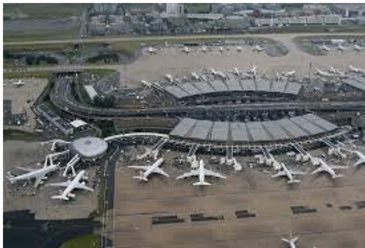
Aeropuerto Charles de Gaulle, París, Francia.

El Aeropuerto Internacional Heathrow de Londres, el principal de la capital británica, es uno de los que tiene mayor tráfico internacional en el mundo y tiene un cargo para los pasajeros de US$ 43,6 para los destinos dentro de Europa y de US$ 61,3 para otros destinos.