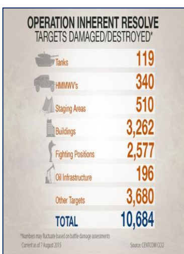
Cuadro izquierdo: De acuerdo a Vocativ, ha existido un aumento de los bombardeos en el mes de julio, en comparación con los meses anteriores. Cuadro derecho: Según los datos del U.S. Central Command, los blancos destruidos de ISIL, de diversa índole, alcanzan ya la suma de 10.684, al mes de agosto de este año.

El reciente aumento en la actividad de la campaña aérea se ha concentrado en ciudades como Ramadi, Mosul, Raqqa y Hasaka, además de otras ciudades en Irak y Siria y es concordante con los esfuerzos de retomar el control de amplias zonas que se encuentran bajo el control de ISIL. De acuerdo con Airwars, una organización de monitoreo del conflicto basado en Inglaterra, se estima que la coalición ha conducido alrededor de 6.200 ataques aéreos en contra de ISIL, contados desde agosto del año pasado. Como resultado de los bombardeos, el grupo estima las pérdidas de ISIL en alrededor de 15.000 combatientes y 489 civiles.