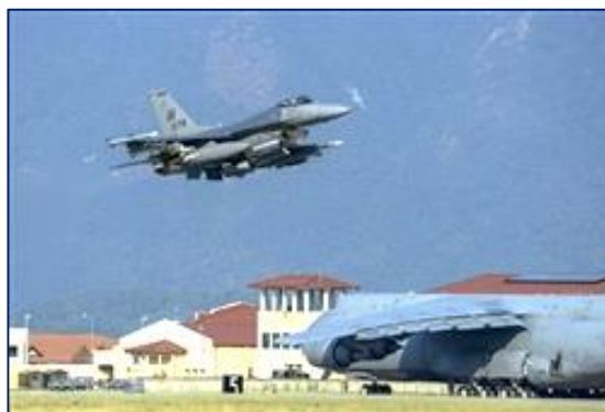
Foto: Un F-16 despegando el 9 de agosto pasado desde la Base Aérea de Aviano, Italia, en ruta hacia la Base Aérea de Incirlik, en Turquía, como parte de la Operación Inherent Resolve. Este despliegue coincide con la decisión de Turquía de permitir que aviones de la USAF empleen sus bases para realizar operaciones en contra de ISIL. Este avión es parte de los seis F-16s asignados para tal efecto. Fuente: USAF.

La participación activa de Turquía en las operaciones aéreas, seguramente significará un punto de inflexión en el devenir del esfuerzo de la coalición internacional en contra de ISIL.