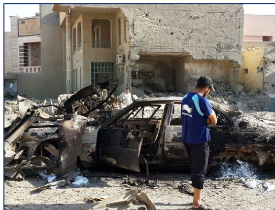
Foto: Un iraquí inspecciona un auto dañado en un ataque aéreo en Fallujah, Irak, el 9 de agosto del 2015. De acuerdo con fuentes locales, los ataques a la ciudad han provocado la muerte de al menos cuatro personas y han dejado docenas de heridos.

Recientemente, los ataques aéreos se han concentrado en los alrededores de la ciudad de Ramadí. Allí las fuerzas iraquíes han rodeado la ciudad y se preparan para su asalto final, en lo que esperan se convierta en la primera victoria significativa en contra de ISIL, por parte de fuerzas iraquíes entrenadas por norteamericanos.