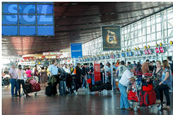
Foto N° 1: Actual sala de embarque nacional e internacional del Aeropuerto Arturo Merino Benítez, de Santiago de Chile.

En las últimas semanas se ha abierto un debate en los medios de comunicación, escritos y audiovisuales, relacionado con el valor de las llamadas “tasas de embarque” o “tasas aeronáuticas”, que se adicionan al precio neto de los pasajes aéreos, nacionales e internacionales, que han culminado en exigencias de rebaja, manifestadas tanto por pasajeros como por ejecutivos de algunas aerolíneas nacionales. Lo anterior, como consecuencia de las ofertas en los precios de estos pasajes, dada la denominación de Low cost (bajo costo, por su sigla en inglés) que están aplicando algunas aerolíneas en rutas nacionales, considerando que, a veces, el valor de estas tasas representan entre un 40 a un 50% o más, del costo total del respectivo pasaje, lo que obviamente llama la atención de los usuarios y de las compañías aéreas. Sin embargo, esa es sólo una parte de la moneda. Lo que está detrás de estos cobros tiene sus fines y propósitos técnicos, los que deben ser conocidos para evitar malinterpretaciones. Este boletín informa sobre estos temas.