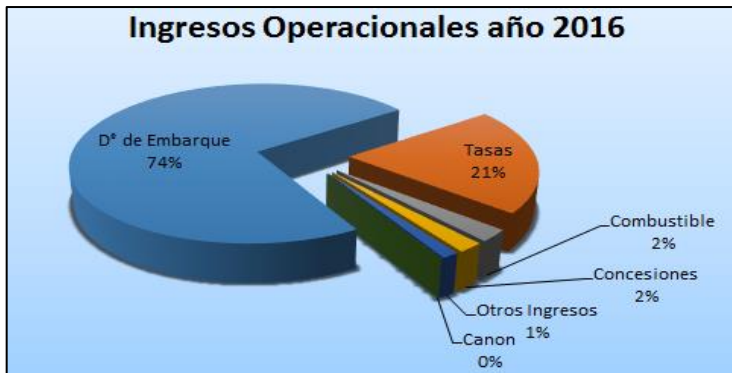
Figura N° 2: Desglose los ingresos operacionales que percibe la DGAC, conforme a la legislación vigente.

el caso particular de AMB, el Estado de Chile (representado por la DGAC) percibe el 77,56 % de los ingresos obtenidos en este aeropuerto, quedando el 22,44% para la Sociedad Concesionaria "Nuevo Pudahuel".