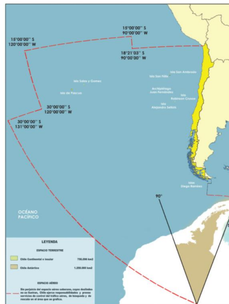
Figura N° 3: Área de responsabilidad de control aeronáutico y de Búsqueda y Salvamento de la FACH, de 32 millones de Km 2 .

en materias de Búsqueda y Salvamento (SAR, por su sigla en inglés), asignada a la Fuerza Aérea de Chile. El significado de este enorme esfuerzo se traduce no tan sólo en contar con equipamiento institucional adecuado sino que también con los medios aéreos capaces de cubrir el área asignada, comunicaciones redundantes, antenas satelitales y sus derivados, todos ellos destinados a la ubicación oportuna de una aeronave en emergencia.