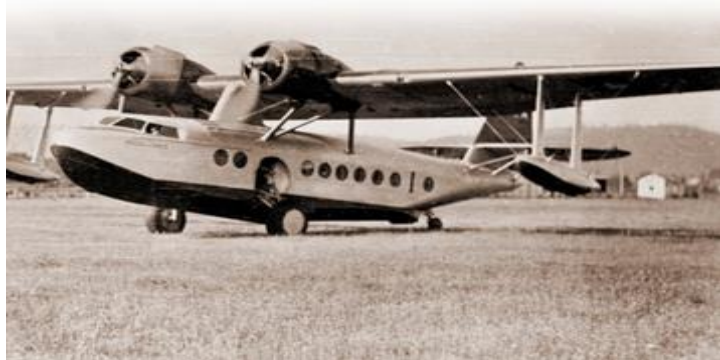
Avión anfíbio Sikorsky S-43 "Magallanes".

Sin embargo, la aventura duró poco tiempo, en Agosto de 1941, el "Magallanes" sufrió un accidente que le costó la baja a principios de 1945. Este hecho, marcó el fin del servicio aéreo militar entre Puerto Montt y Punta Arenas. Tiempo después, la Línea Aérea Nacional (LAN), realizó los estudios para volver a operar en forma regular hasta la zona austral.