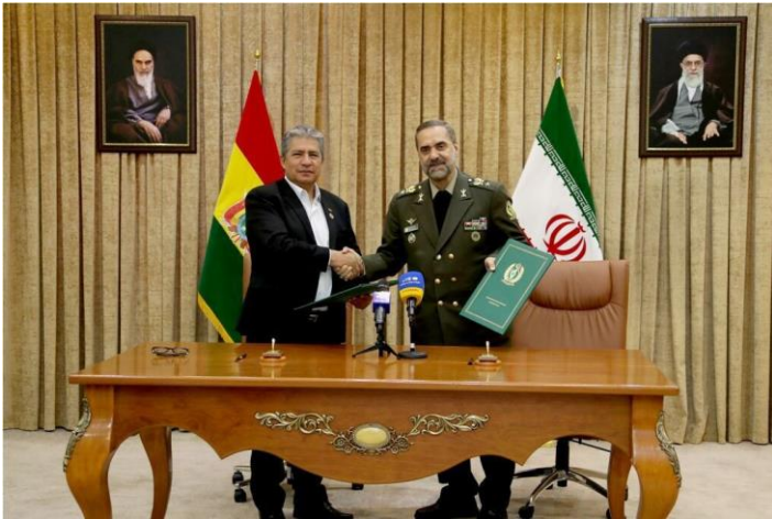
El ministro de Defensa de Irán, Mohamad Reza Qarai Ashtiani y su homólogo boliviano, Edmundo Novillo

A mediados de Julio del 2023, en Teherán, los ministros de Defensa de Bolivia, Edmundo Novillo, y el ministro de Defensa de Irán, Mohammad Reza Gharaei Ashtani, firmaron un acuerdo de cooperación internacional, que según lo señala el diario El Deber de Bolivia, incluiría aspectos relacionados con el litio, misiles, armas e inteligencia en el ciberespacio.